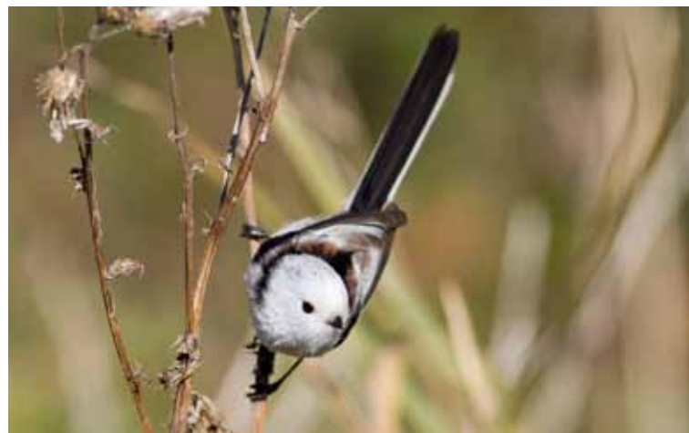
Stjärtmesen, en vacker fågel som numera upptäckt fågelborden.

Varifrån kom då alla dessa domherrarna? Delvis handlade det nog om fåglar från svenska skogar som hade svårt att hitta mera naturliga föda, bl.a. ask- och lönnfrön. Men sannolikt fick vi också ett inflöde från öster, dvs. av finska och ryska domherrarna.