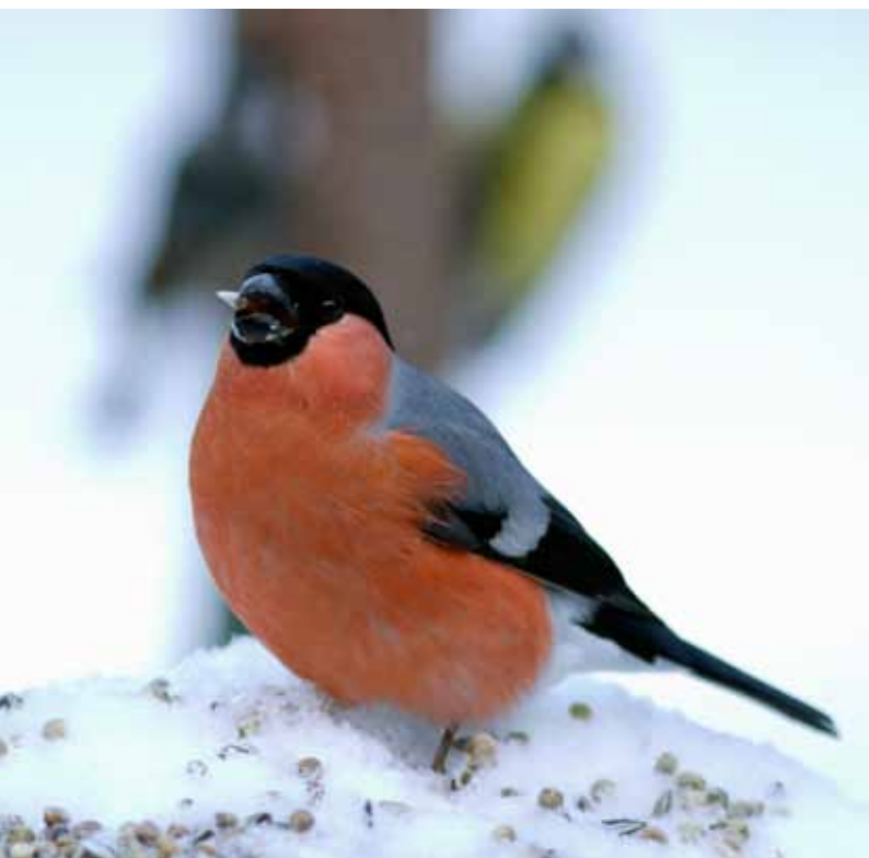
Domherren uppträdde talrikt vid många fågelmatningar.

Något liknande samband finns inte hos stjärtmesen. Där verkar det snarare handla om att arten som sådan i allt större omfattning upptäckt fågelmatningar, framför allt talgbollar, som en viktig födokälla vintertid. Går vi 20 år tillbaka i tiden, var det mycket ovanligt med stjärtmesar vid fågelmatningar.