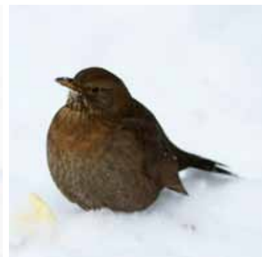
Koltrasten (hanne t.v. och hona t.h.) minskade kraftigt i antal.

Totalt sett var det i det närmaste lika många rapportörer som bidrog med uppgifter i år som i fjol. Vi räknar med ca 19 450 i år jämfört med ca 19 500 förra året. Att vi skriver "ca" beror på att det förekommer dubbla rapporter och att det ibland kan vara svårt att avgöra detta.