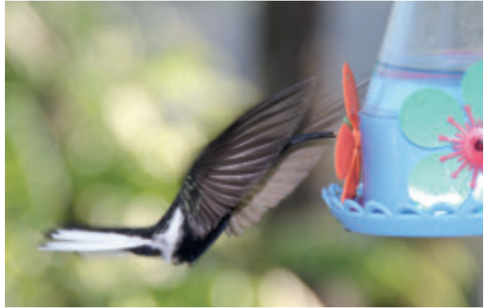
Flera arter av kolibrier var extremt lätta att studera i detalj när de kom fram till nektarautomaterna. Här vid hotellet Ypê i Itatiaia nationalpark. Till vänster rubinstrupe Clytolaema rubricauda , som kunde se rätt intetsägande ut men som i rätt ljus visade sin glänsande strupe. Till höger svart jakobin Florisuga fusca , en av de allra sobraste kolibrierna